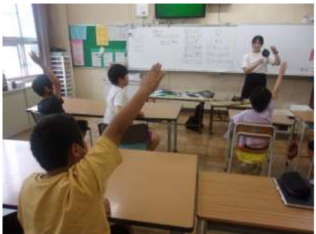
7/14 〈食育（さくら・もみじ学級）〉