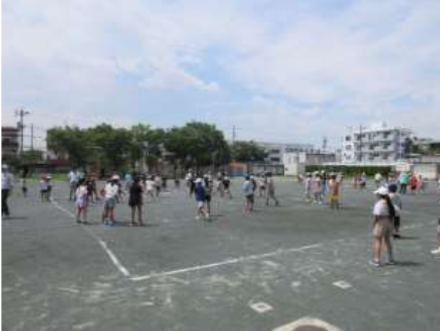
7/11 〈ドッジボール大会（自由参加）〉